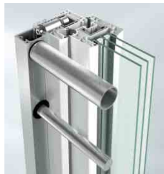
Befestigung mit Profildübel

Stangenvariante Durchmesser von 12 bis 35 mm