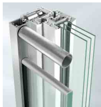
Befestigung mit Profildübel