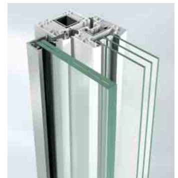
Befestigung mit Falzleiste

Stangenvariante Durchmesser von 12 bis 35 mm