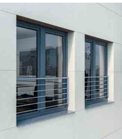
Individuelle Akzente setzen mit der Stangenvariante der Schüco Absturzsicherungen