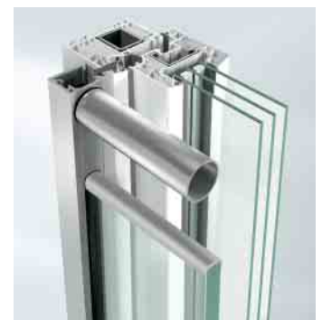
Befestigung mit Falzleiste