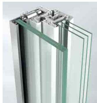
Befestigung mit Profildübel

Glasvariante Glasstärken von 10 bis 16 mm