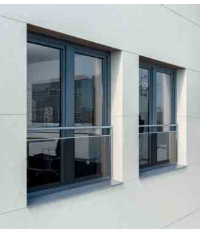
Als kombinierte Variante mit Stange und Glas bilden Absturzsicherungen ein Highlight in der Fassadenansicht

Bauherren wünschen sich heute hellere, lichtdurchflutete Räume. Entsprechend geht der Trend zu raumhohen, bodentiefen Fensterelementen, deren Absturzsicherheit durch Normen und Verordnungen geregelt ist. Dies ging bisher oft zu Lasten der Fassadenoptik. Die neuen Absturzsicherungen für Schüco Kunststoff-Systeme werden direkt am Fensterprofil montiert und fügen sich so harmonisch in das Fassadenbild ein. Überdies sind sie als komplette Einheiten mit Schüco Kunststoff-Fenstern geprüft und bieten maximale Sicherheit sowie entscheidende Effizienzvorteile bei der Verarbeitung und Montage.